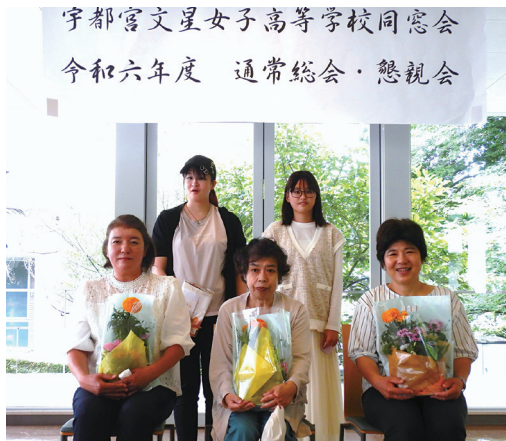
成人と還暦のお祝い

コロナ禍後2回目の同窓会が6月23日(日)母校レストラン「グリーンブリーズ」にて開催されました。 今回も感染症対策の関係から懇親会での会食はなく、お菓子と飲み物を各席に用意いたしました。 昭和30年から今年卒業されたばかりの同窓生・先生方合わせて60余名の参加がありました。